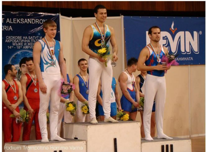
Podium Trampoline Homme Varna

« Les finales ont mal débuté pour moi, parce que je fais une erreur vraiment bête à la fin de l'exercice qui nous coûte la médaille d'or ! J'étais très très déçu, et j'ai voulu prendre ma revanche en individuel. Et à l'inverse ça s'est vraiment bien passé parce que je pense avoir fait mon meilleur libre individuel en compétition. »