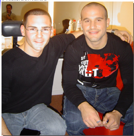
Frédéric MICHALAK (Équipe de France de Rugby) présent sur le plateau, a bien voulu poser pour notre album souvenir