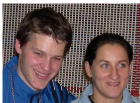
Henrik et Anna

Le 28 Janvier prochain la ville de Bad Kreuznach organise un gala exceptionnel en l'honneur de deux grands champions : Anna DOGONADZE (championne olympique 2004 de Trampoline) et Henrik STEHLIK (champion du monde 2003 de Trampoline).