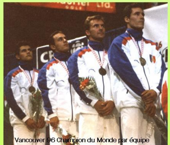
Vancouver 96 Champion du Monde par équipe

mondial 1996 à Vancouver et qui demeurera dans les annales du trampoline hexagonal. En qualifications, l'enfant d'Issy les Moulineaux prend la tête avec notamment un exercice imposé mythique (aujourd'hui appelé « libre 1 ») et obtenant la note de 10 par la juge australienne, pour un total de 29.50 pts, record du monde de l'imposé. Une petite fausse note en finale conduit Manu à céder cette couronne qui lui tendait les bras à Dimitri POLIAROUGH (BLR), prenant une médaille d'argent du même métal que celle obtenue peu avant avec David MARTIN en synchronisé. L'apothéose était venue du titre mondial par équipe remporté la