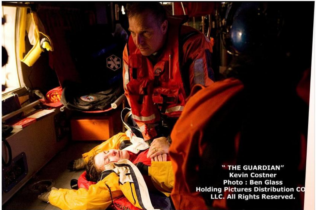
"THE GUARDIAN" Kevin Costner

À noter: toucher à de nombreuses activités sportives, comme papa l'encourageait, et pousser mes limites m'a énormément aidé dans mon domaine de prédilection. Alors que j'ai toujours compris qu'apprendre à prendre des risques en toute sécurité, comme nous le faisons, m'aiderait à l'âge adulte dans n'importe quelle profession, jamais dans mes rêves les plus fous je n'ai pensé que mon choix de carrière suivrait littéralement cette ligne. La fa-