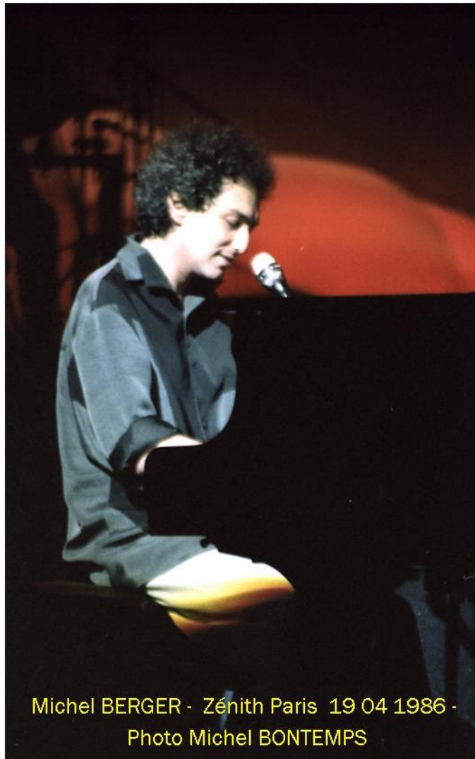
Michel BERGER - Zénith Paris 19 04 1986

As-tu des anecdotes de backstage à nous raconter ? (Celle de ta rencontre avec Johnny par exemple...)