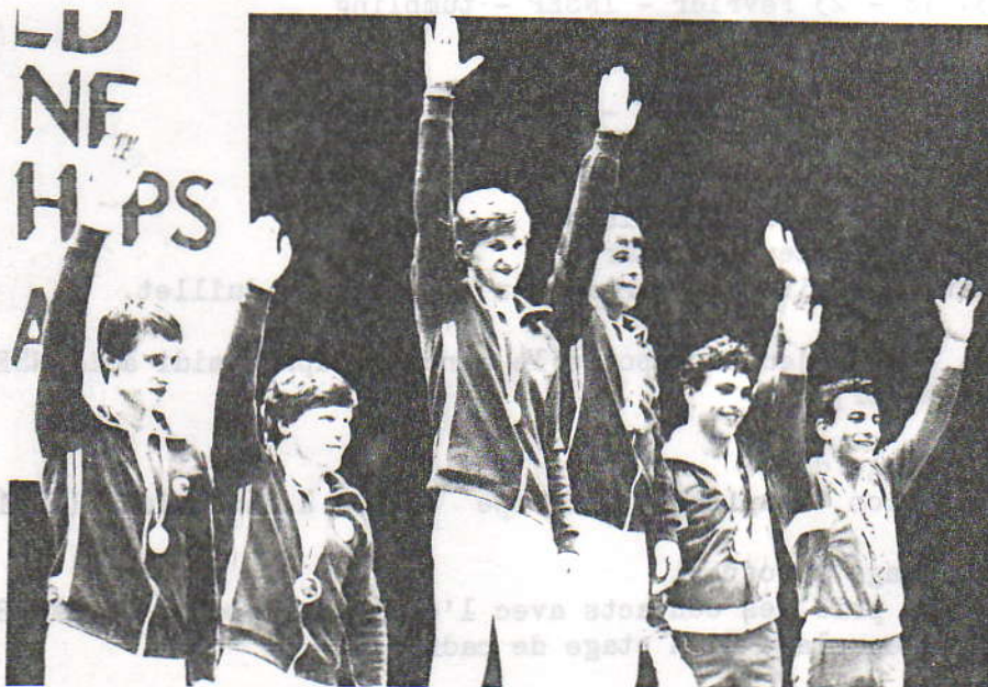
Les Trois meilleures équipes du Monde en Synchronisé