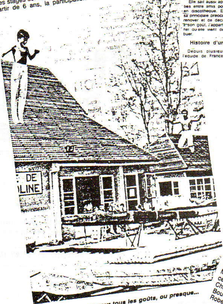
Il y aura des stages pour tous les goûts, ou presque...

étant de 380 francs par personne : Du 14 au 18 août inclus : au Sain Gym de 14h à 17h. Du 21 au 25 août : au gymnase de Champ-Fleuri, Saint-Denis, de 14h à 17h. Du 28 août au premier septembre : à Saint-Pierre, au gymnase de la salle polyvalente de Terre-Sainte, de 14h à 17h. A noter enfin que les dimanche 13, 20 et 27 août sera proposé un stage de formation de cadres, découverte et initiation à l'acro-sport. Ouvert à tous, pour une participation de 200 francs par personne, ce stage se déroulera au Tropicclub des Aigrettes, à Saint-Gilles, de 9h à 12h et 13h30 à 15h30. Pour tous renseignements sur ces différentes formules, téléphoner au 24.01.28 ou 24.40.1